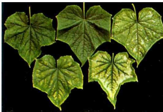
Рис. 4. Признак недостатка магния в листьях огурца

Магний. Недостаток хлорофилла проявляется в посветлении листьев, окраска листьев изменяется с зеленой на желтую, красную, фиолетовую. Между зелеными жилками листа проявляется хлороз (рис. 6). У томатов на листьях между жилками появляются коричневые пятна, лист вянет, засыхает и опадает. Опадают плодоножки. Плоды мелкие, созревание преждевременное. У огурца на старых листьях проявляется хлороз. Желтеют с краев пластинки листа. Жилки и пластинка вокруг полосой около 5 см еще сохраняет нормальный зеленоватый цвет.