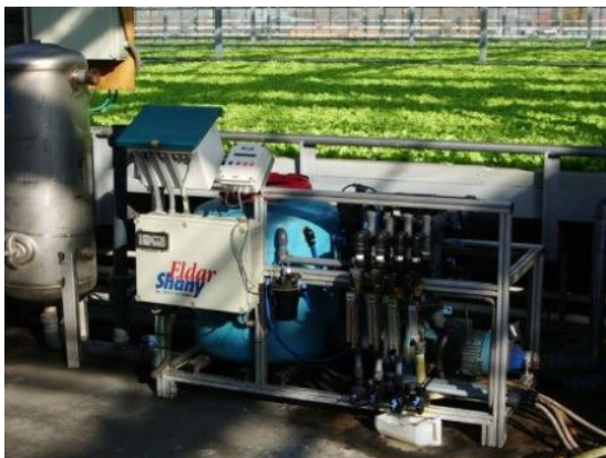
Рис. 2. Оборудование для смешивания растворов

Рабочий раствор рекомендуется получать разведением маточного раствора водой в соотношении 1:100, допустимо 1:50 или 1:200. Растворы А и Б подают одновременно и разбавляют водой до заданной электропроводности рабочего раствора (ЕС).