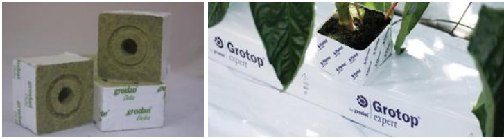
Рис. 1. Минеральная вата

Все минераловатные плиты стандартной плотности пригодны для использования. Два основных преимущества минеральной ваты – ее стерильность и способность обеспечивать оптимальное соотношение воздуха и воды в корневой зоне при соответствующем регулировании интенсивности полива. Культура и субстрат всегда должны быть полностью изолированы от пола теплицы. Основной особенностью минеральной ваты является то, что она позволяет регулировать водно-воздушный режим. Это значит, что культура никогда не будет страдать ни от водного стресса, иссушения или от подтопления, ни от кислородного голодания.